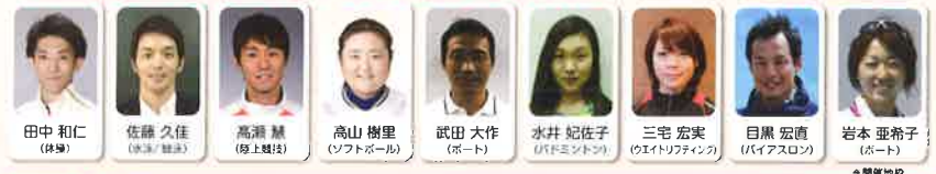
オリンピック・ムーブメントアンバサダー